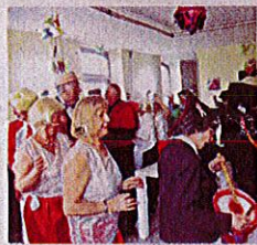
Les aînés de l'Eau Vive ont conquis les résidents de Saint-Joseph, ca.

Eau Vive : la joyeuse troupe investit la maison de retraite